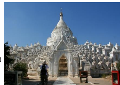
เจดีย์ชินพิวมิน (เมียะเต็งดาน)